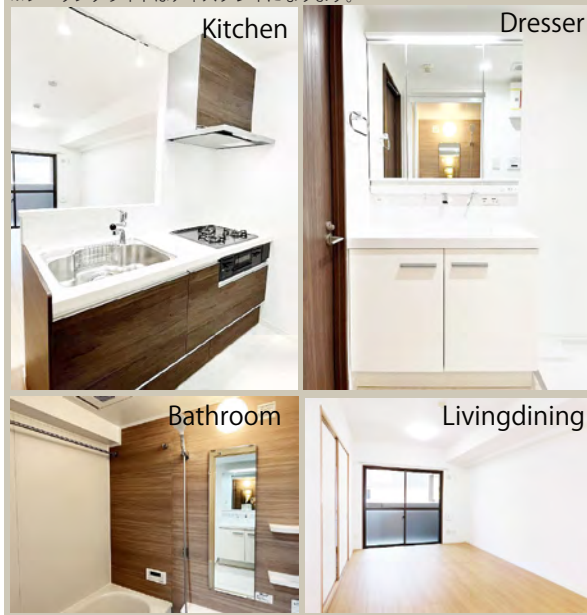
おすすめポイント