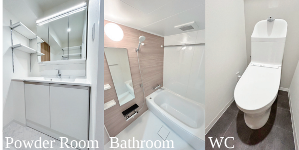
Powder Room Bathroom