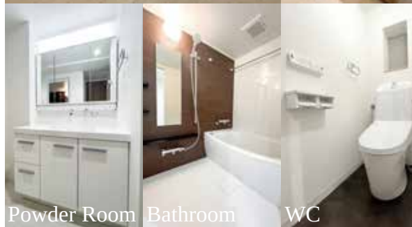
Powder Room Bathroom