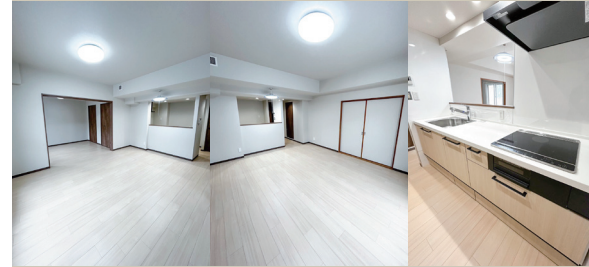
Living Living Kitchen