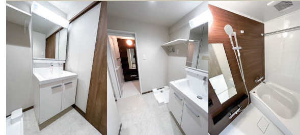
Powder Room Powder Room Bathroom