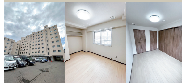
Exterior Bedroom Bedroom