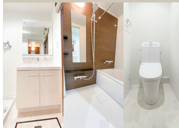
Powder Room Bathroom