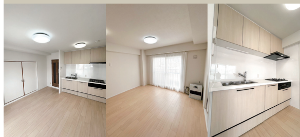
Living Living Kitchen