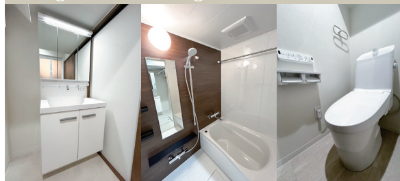
Powder Room Bathroom WC