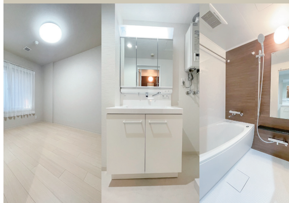
Bedroom Powder Room Bathroom