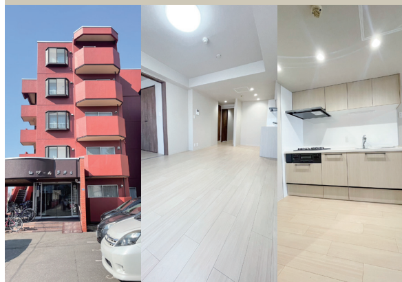
Exterior Living Kitchen