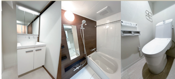
Powder Room Bathroom WC