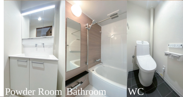
Powder Room Bathroom