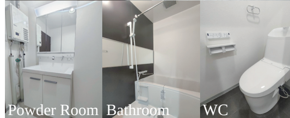
Powder Room Bathroom