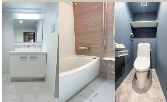
Powder Room Bathroom WC