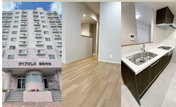
Exterior Living Kitchen