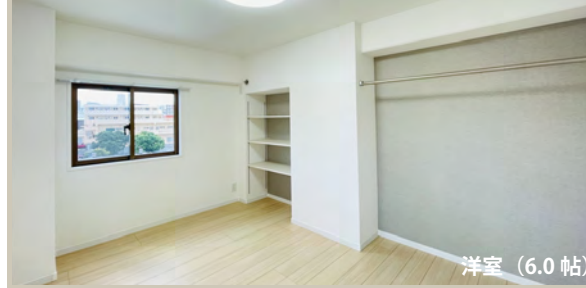
洋室 (6.0 帖)