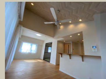
内装リノベーション済