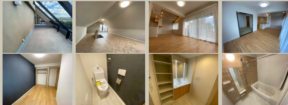
おすすめポイント