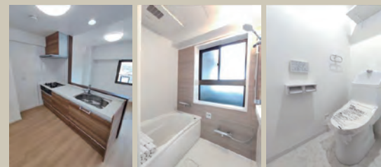
Kitchen Bathroom W.C