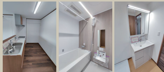
Kitchen Bathroom Powderroom