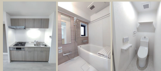
Kitchen Bathroom W.C