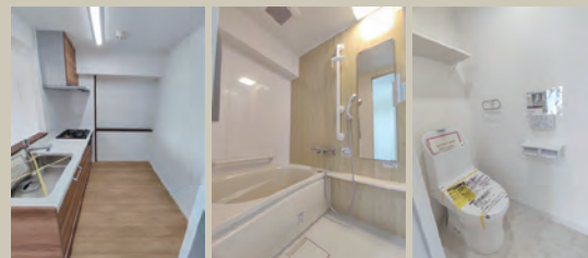
Kitchen Bathroom W.C