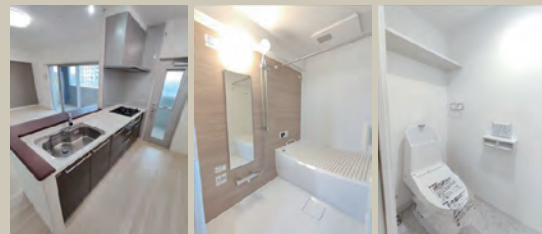
Kitchen Bathroom W.C