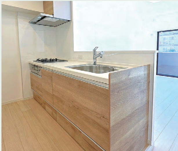
扉カラー：オークラテ