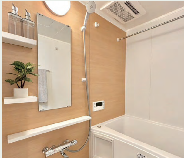
アクセントパネル：カルムグレーウッド

機能的なアイテムで、いつでも快適なお風呂空間へ。 スマートカウンターが浴室空間を引き立てます。