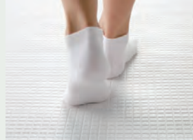
カラリ床 翌朝にはカラッとさわやか。 水が引いて翌朝カラリ。