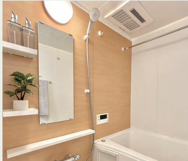
アクセントパネル：カルムグレーウッド

機能的なアイテムで、いつでも快適なお風呂空間へ。 スマートカウンターが浴室空間を引き立てます。