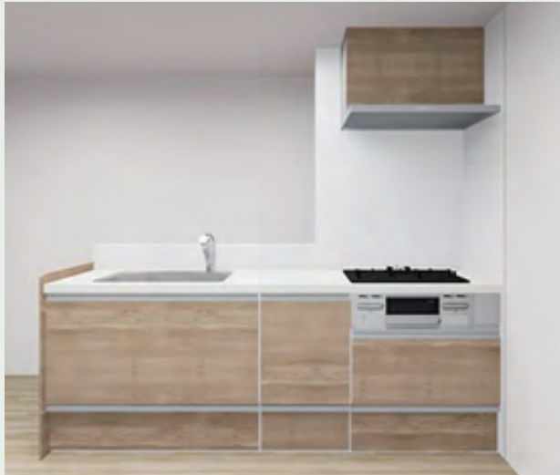
扉カラー：オークラテ