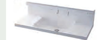
キレイアップカウンター バックガードがミラー下まであり洗面ボウルと 一体成形になったキレイアップカウンター。 つなぎ目などの凹凸がなく、飛び散った水滴を サッと拭き取れます。