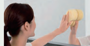
お掃除ラクラク鏡 表面を炭素の膜で覆ったお掃除ラクラク鏡 なら、簡単なお手入れで水あかを楽に落と せます。