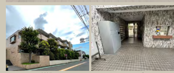
マンション外観 エントランスロビー