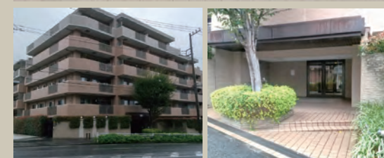
外観 エントランス