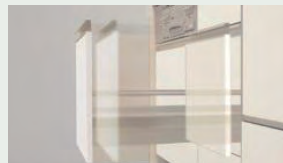
サイレントレール やさしく静かに閉まる ダンパー機能を搭載