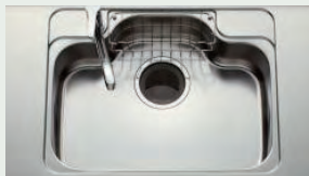
ステンレスシンク 水はね音が抑えられるため、 会話を妨げられることはありません。