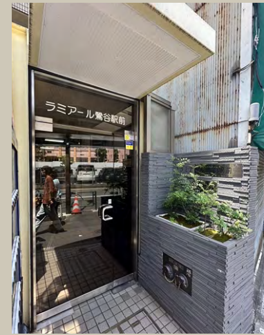
マンションエントランス