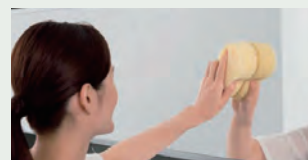
お掃除ラクラク鏡 表面を炭素の膜で覆ったお掃除ラクラク鏡 なら、簡単なお手入れで水あかを楽に落と せます。