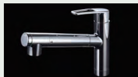
浄水器内蔵型水栓