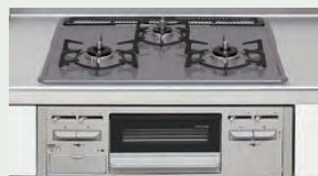
ホーロートップコンロ (3口/60cm)