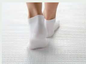
カラリ床 翌朝にはカラッとさわやか。 水が引いて翌朝カラリ。