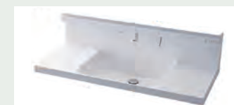
キレイアップカウンター バックガードがミラー下まであり洗面ボウルと 一体成形になったキレイアップカウンター。 つなぎ目などの凹凸がなく、飛び散った水滴を サッと拭き取れます。