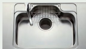
ステンレスシンク 水はね音が抑えられるため、 会話を妨げられることはありません。