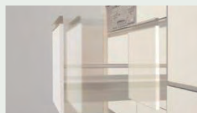
サイレントレール やさしく静かに閉まる ダンパー機能を搭載