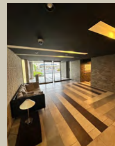
マンション エントランス