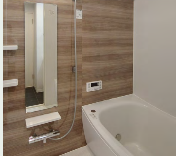
アクセントパネル：ノルディーグレーウッド

機能的なアイテムで、いつでも快適なお風呂空間へ。 スマートカウンターが浴室空間を引き立てます。