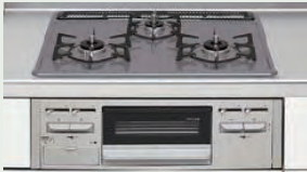
ホーロートップコンロ (60cm)