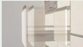
サイレントレール やさしく静かに閉まる ダンパー機能を搭載