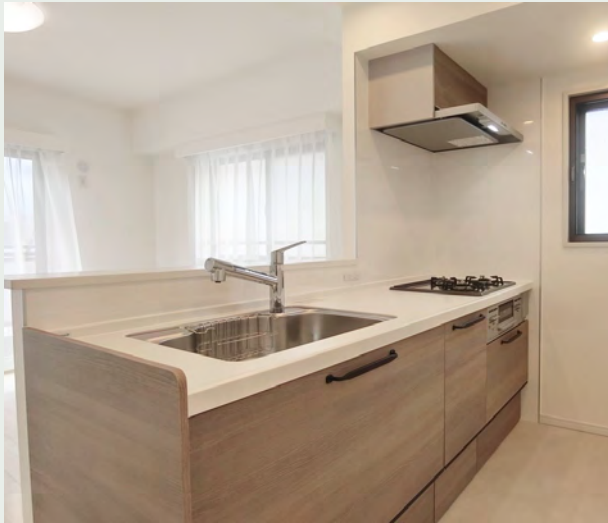
扉カラー：エルムモカ