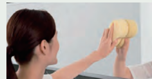
お掃除ラクラク鏡 表面を炭素の膜で覆ったお掃除ラクラク鏡 なら、簡単なお手入れで水あかを楽に落と せます。