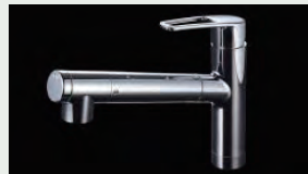
浄水器内蔵型水栓