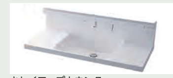
キレイアップカウンター バックガードがミラー下まであり洗面ボウルと 一体成形になったキレイアップカウンター。 つなぎ目などの凹凸がなく、飛び散った水滴を サッと拭き取れます。