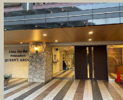
マンションエントランス