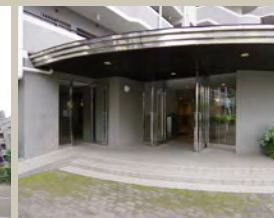
マンションエントランス