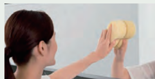
お掃除ラクラク鏡 表面を炭素の膜で覆ったお掃除ラクラク鏡 なら、簡単なお手入れで水あかを楽に落と せます。