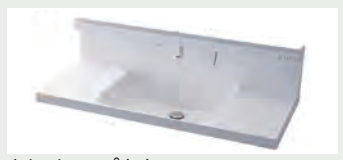
キレイアップカウンター バックガードがミラー下まであり洗面ボウルと 一体成形になったキレイアップカウンター。 つなぎ目などの凹凸がなく、飛び散った水滴を サッと拭き取れます。