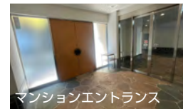
マンションエントランス