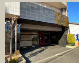
マンションエントランス