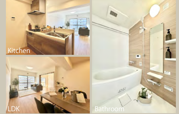
内装写真 (室内の家具類はディスプレイ用につき売買対象に含まれません。)