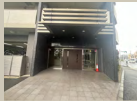
マンションエントランス