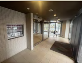
マンションエントランス