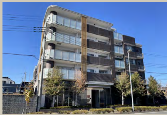
外観・エントランス写真