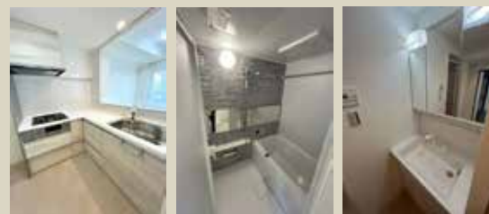
Kitchen Bathroom Powderroom