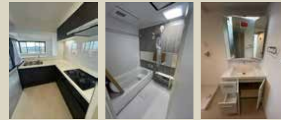
Kitchen Bathroom Powderroom