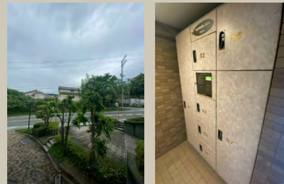
おすすめポイント