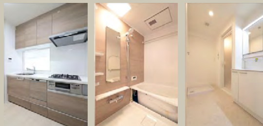
Kitchen Bathroom Powderroom