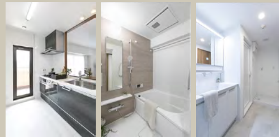
Kitchen Bathroom W.C