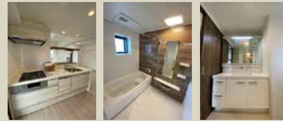
Kitchen Bathroom Powderroom