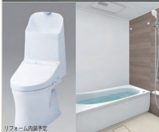
リフォーム内装予定