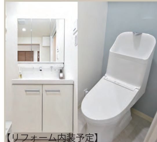
【リフォーム内装予定】